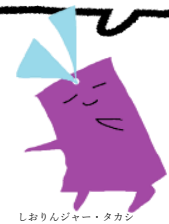
しおりんジャー・タカシ