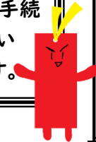
しおりんジャー・マサル

貸出期間は二週間です。読み終わっていないときは、期間延長の手続きをしてください。予約が入っていない場合は、継続して貸出できます。